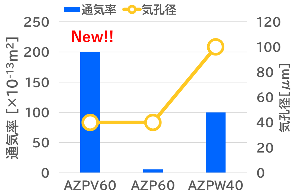
通気率と気孔径の比較